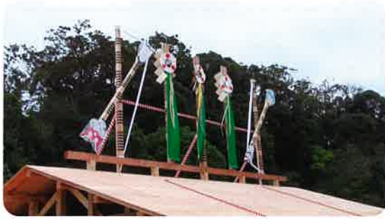
上棟祭祭壇⑤と屋根飾り⑤ 三本御幣と天の矢・地の矢。