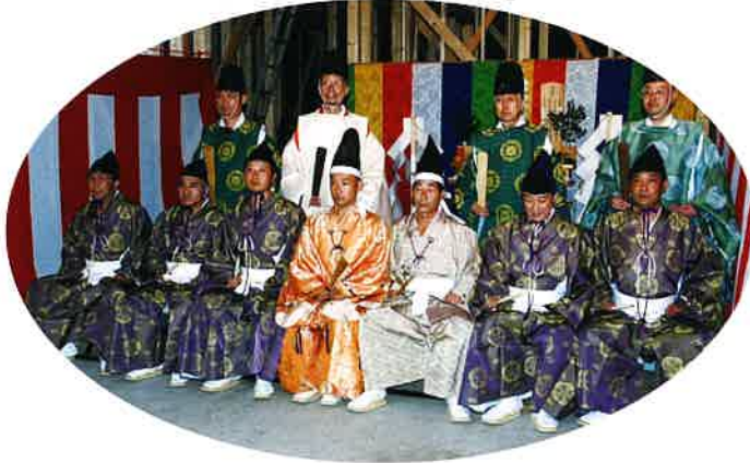
神職ならびに「工匠」のみなさん

十月十八日、上棟祭の運びとなりま した。工務店の大工さんたちが直垂 装束で「工匠」の所役をおつとめさ れました。